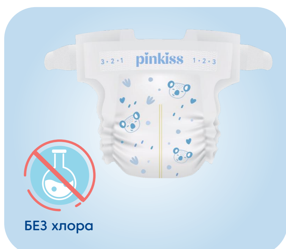
Без обработки хлором