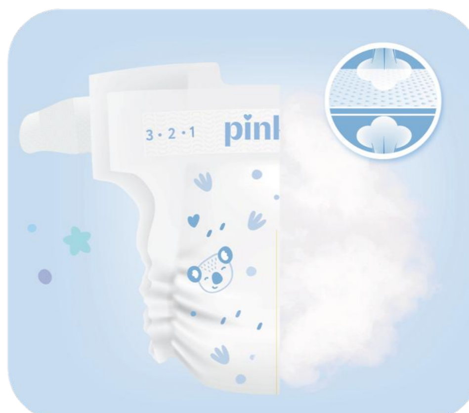
Обработка горячим паром