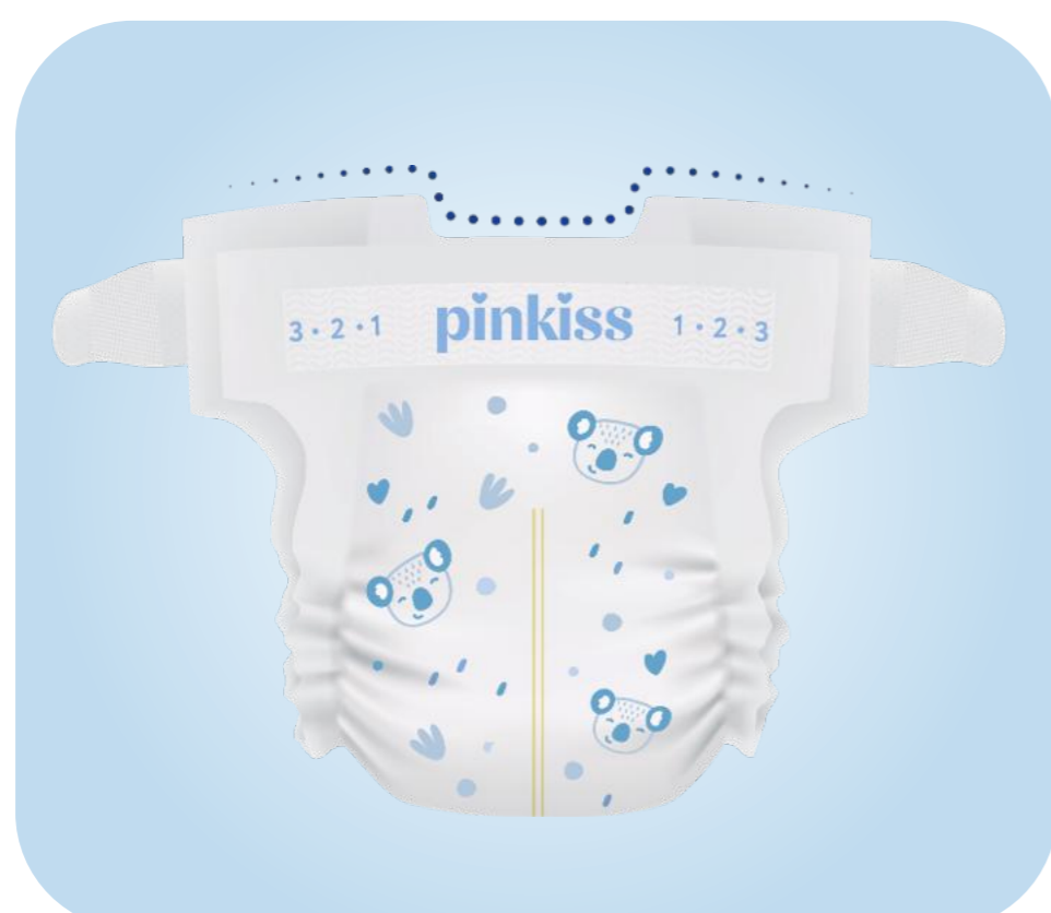
Вырез для пупочка